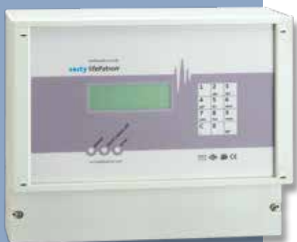
MASTER Συσκευή προειδοποίησης

Ιδίως για συγκροτήματα κατοικιών σε πολυκατοικίες και πολυώροφα κτίρια η από κοινού απόκτηση και χρήση ενός μόνο κοινόχρηστου συστήματος συμφέρει αφού το κόστος επιμερίζεται αναλογικά σε όλους τους ιδιοκτήτες και ενοικιαστές.