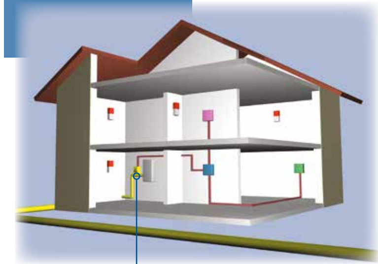
Απομόνωση παροχής αερίου μέσω ηλεκτρομαγνητικής βαλβίδας