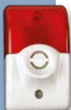
SIR Σειρήνα οπτική/ακουστική