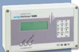
TABD Κεντρική Μονάδα Χειρισμού και Παρακολούθησης